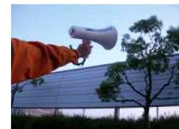
（人為圧等による措置）忌避音