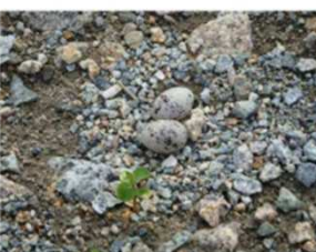
コアジサシの巣・卵