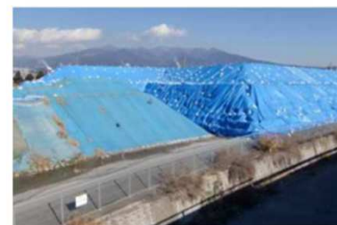
（面的措置）ブルーシート被覆